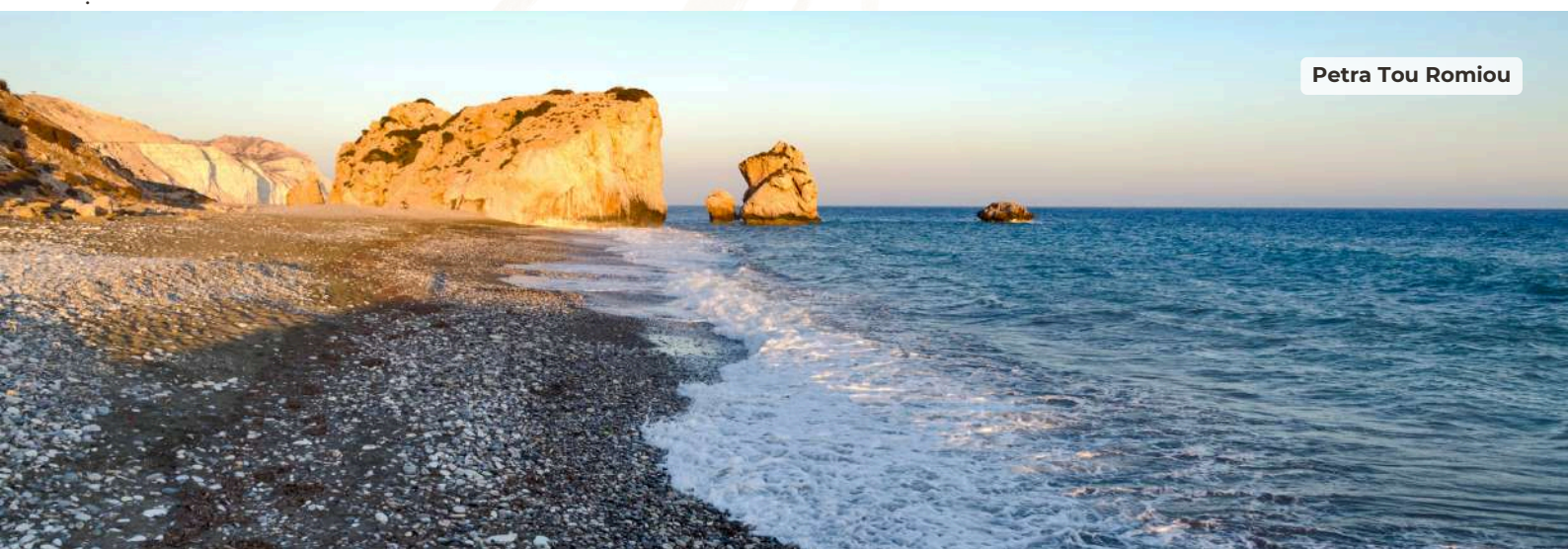
Petra Tou Romiou

Desayuno. Salida hacia el oeste por la autopista, junto a la costa sur de la isla, hasta llegar a nuestra primera parada, Petra tou Romiou. En este lugar de la costa, entre Limassol y Pafos, es donde la tradición mitológica griega localiza el lugar donde surgió de las espumas blancas del mar Afrodita, diosa del amor y de la belleza. Continuación hasta Kato-Pafos donde veremos las llamadas actualmente Tumbas de los Reyes, datado del periodo entre los siglos III a. C. - III d. C. Tiempo libre en el puerto pesquero de Pafos. Continuación hasta el Parque Arqueológico de Pafos para visitar esta enorme zona arqueológica excavada en 1962 y recientemente declarada Patrimonio Cultural de la Humanidad por la UNESCO. Aquí encontramos uno de los conjuntos de mosaicos más importantes y ricos de todo el Mediterráneo, cuya visita es obligatoria y cuya edad abarca desde el s. II d. C. hasta el s. IV d. C. Por la tarde, visita del Pilar del Apóstol San Pablo. Regreso al hotel. Tiempo libre. Alojamiento.